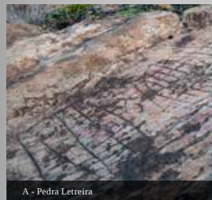
A - Pedra Letreira