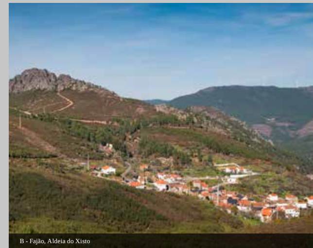
B - Fajão, Aldeia do Xisto

Protegida pelos Penedos do Fajão, esta é a segunda Aldeia do Xisto em altitude. Tem um conjunto alargado de serviços (MB, WC, piscina pública, parque de merendas, Loja Aldeias do Xisto, café, restaurante, alojamento, Caminho do Xisto). Próximo nasceu Monsenhor Nunes Correia que, para além de praticante da fé, era artista. Tem aqui o seu museu.