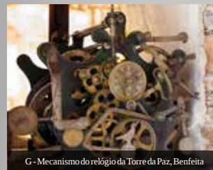
G - Mecanismo do relógio da Torre da Paz, Benfeita

A Aldeias Históricas de Portugal foi a primeira rede de aldeias a ser criada e à qual o Piódão logo aderiu. Sem a monumentalidade que caracteriza as aldeias desta rede, mas sendo um bom exemplo de construção e organização das aldeias em xisto, ficaria porventura bem ao lado das 27 aldeias que constituem a, mais recente, Rede das Aldeias do Xisto. Tem Posto de Turismo/Núcleo Museológico.