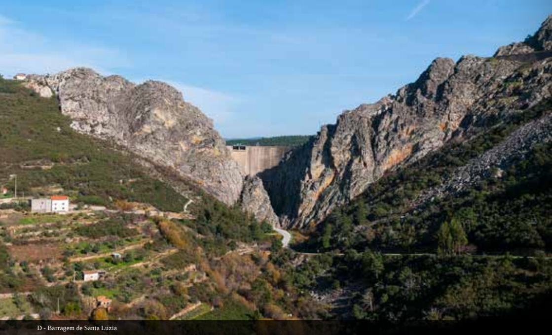
D - Barragem de Santa Luzia