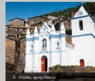
E - Piódão, Igreja Matriz